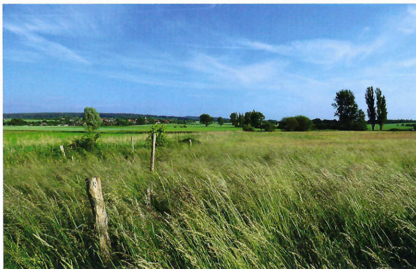
Grünlandniederung als potenzieller Standort für eine naturnahe Rückhaltefläche.

Da ein wassergesättigter Boden bei den hiesigen landwirtschaftlichen Kulturen kaum zu bearbeiten ist, was insbesondere im zeitigen Frühjahr die Feldbestellung zeitlich stark verzögern würde, wurden über die vergangenen Jahrzehnte große Flächen mit einem engmaschigen Drainagesystem zur Abführung überschüssigen Wassers versehen. Spezielle in