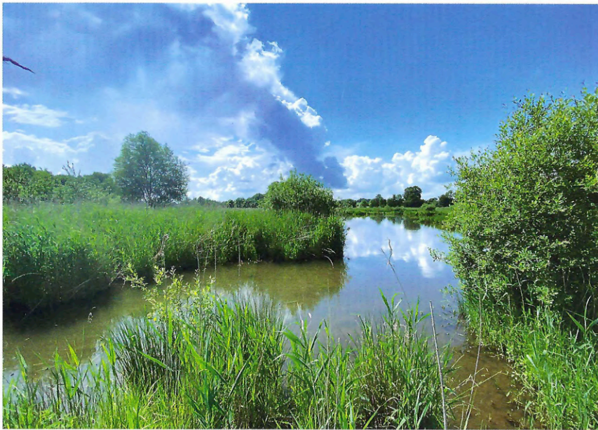
Schwammlandschaft in der Schunteraue. Im Renaturierungsgebiet Stemmwiesen sorgt ein großflächiges Mosaik aus Gewässern, Auwäldern, Wiesen, Weiden und Röhrichtern nicht nur für eine hohe Biodiversität, sondern trägt auch zum Hochwasserschutz sowie zur Niedrigwasseraufhöhung in Trockenzeiten bei.

Schwamm wirkt. Die Landschaft als Ganzes erhöht die natürliche Wasserrückhaltung (Retention). Eine vielschichtige Vegetation, ein humoser Oberboden, kleine Senken im Relief, windungsreiche Fließgewässer mit einer natürlicherweise hohen Rauigkeit durch Wasserpflanzen und Röhrichte, und vor allem noch funktionierende Flussauen, all das zusammen bewirkt ein hohes Retentionsvermögen im Einzugsgebiet.