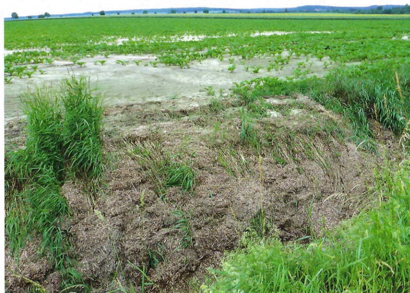
Fehlende Wasserrückhaltefähigkeit der Landschaft führt zu Hochwasserspitzen und Gewässerbelastungen.

den Boden eingebrachte, engmaschig angeordnete Drainagerohre sammeln das infiltrierte Regenwasser und verkürzen so die Wege der horizontalen Wasserbewegung ganz beträchtlich. In der Folge wird das Wasser ‚quasi sofort‘ in die angrenzenden Fließgewässer, die nun als Vorfluter bezeichnet werden, abgeführt. Der horizontale und natürlicherweise stark verzögerte Wasserabfluss im Boden (im Mittel einige Dezimeter pro Tag) wird damit drastisch beschleunigt, und nach starken Regenfällen kommt es zu einem beschleunigten Wasserabfluss. Hinzu kommt, dass der noch schnellere direkte Oberflächenabfluss durch Bodenverdichtung und -versiegelung sowie Vergrößerung der landwirtschaftlichen Schläge ebenfalls erhöht wird.